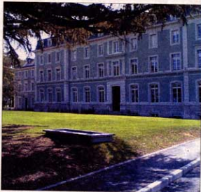
Bois-Salève. Calme et luxe à deux pas de Genève.